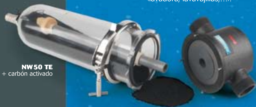
NW50 TE + carbón activado

El carbón activado CINTROPUR® SCIN elimina los sabores y olores del agua, reduce el cloro y los micro-contaminantes como pesticidas y otras sustancias disueltas.